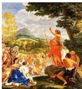
Sono stato mandato avanti a lui.